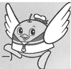
鳥取県マスコットキャラクター「トリピー」