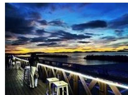
皆生温泉海遊ビーチ（令和4年度）